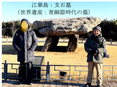
江華島：支石墓 (世界遺産：青銅器時代の墓)