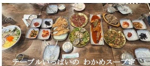
テーブルいっぱいの わかめスープ定

1月1日の元旦は、ソウル駅に新設された高速地下鉄（GTX：時速170km）を体験しました。写真の様な超長いエスカレーターで地下7階にある乗車ホームまで降り、真新しい車両に乗ると、横座り座席？「時速170kmでシートベルト無し？」と不安を感じながら出発しましたが、ほとんど揺れず快適な乗り心地で目的地に到着しました。地下鉄で鐘路3街に戻り、孫家族と合流して、珍しい「わかめスープ専門店」でたっぷりの昼食を堪能しました。