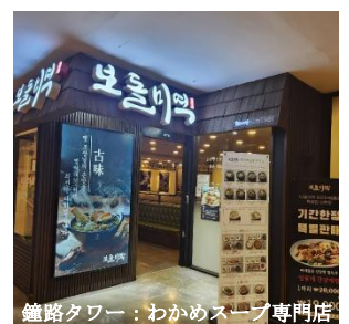
鐘路タワー：わかめスープ専門店

3歳の孫娘と久しぶりに再会し、元気に伸び伸び？育っていることに感謝しました。女兒は青年になっても徴兵が無いと一安心していますが、バイリンガルに育っている孫娘と一緒に、日韓の平和を祈る日を楽しみに、もう少し爺さん頑張ります。